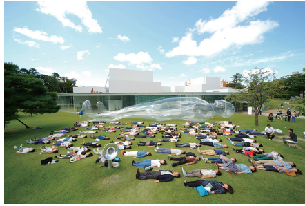
＜大きな空気の人＞

空気を人に見立てた透明の作品と共に芝生の上で昼寝をしてみませんか。10月30日(金)の夜にはライトアップされるかびあがる、大きな空気の人をご観頂けます。