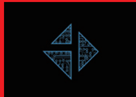
⑨ 3331α Art Hack Day