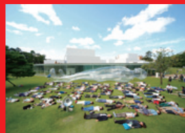
⑥ 「大きな空気の人」撮影: 木奥恵三 画像提供: 金沢21世紀美術館