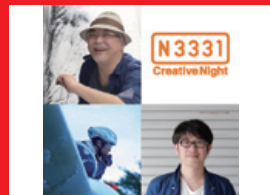
⑧ N3331 クリエイティブナイト