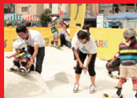
④ 神田スポーツ&カレール EXPO2014の様子