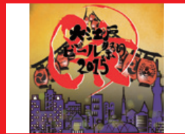
② 大江戸ビール祭り2015