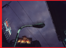
⑦ 街灯と鳩よけ 1992年