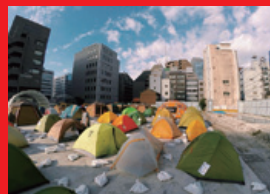
⑤ アーバンキャンプトーキョーホテル2014の様子