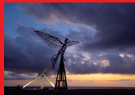
③ Burning Japan 2013